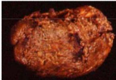
Gambar 2. Umbi kentang yang terserang penyakit busuk lunak bakteri (Astarini et al., 2018).

termasuk bakteri Gram negatif yang memiliki bentuk batang dan berflagel serta memiliki kemampuan hidup pada kondisi aerob dan anaerob. Beberapa jenis bakteri ini hanya mampu hidup di lingkungan yang hangat, salah satunya adalah Erwinia carotovora yang menyebabkan penyakit busuk lunak bakteri. Penyakit ini menyebabkan gejala busuk yang mampu mengubah fisik, fisiologi dan kimia pada beberapa tanaman hortikultura, khususnya pada umbi kentang ( Gambar 2 ). Penyakit ini mampu tersebar akibat bakteri Erwinia carotovora terbawa oleh tanah dan sulit untuk dikendalikan secara kimiawi dan penyebaran dari bakteri ini berlangsung sangat cepat (Javandira et al. 2013). Namun, faktor utama dalam penyebaran penyakit ini adalah kelembaban udara yang tinggi.