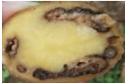
Gambar 4. Umbi kentang yang terserang penyakit layu bakteri (Wenas, M. et al.,2016)

Interaksi bakteri awal dengan permukaan tanaman melibatkan perlekatan reversibel dan ireversibel melalui polisakarida, protein adhesi dan perlekatan permukaan sel seperti pili (Hoffman et al. 2015).