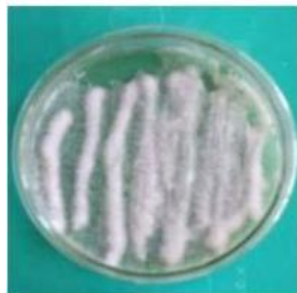
Gambar 2. Pertumbuhan koloni B. bassiana pada media PDA berumur 21 HSI.

Pengamatan secara makroskopis terhadap koloni Beauveria bassiana yang ditumbuhkan pada media Potato Dextrose Agar (PDA) menunjukkan bahwa koloni awalnya tampak berwarna putih (Gambar 2). Seiring dengan bertambahnya umur koloni, warna tersebut berubah menjadi kekuningan keruh. Pada usia 21 hari setelah inokulasi (HSI), koloni cendawan mencapai diameter antara 8-9 cm, menandakan bahwa pertumbuhan koloni telah mencapai tahap optimal pada media padat. Pada fase ini, cendawan mulai memproduksi konidia secara aktif, yang merupakan struktur utama dalam proses infeksi terhadap serangga inang. Meskipun demikian, produksi konidia yang paling efisien terjadi ketika B. bassiana dikultivasi pada media cair, di mana waktu yang dibutuhkan untuk mencapai produksi konidia maksimal hanya sekitar 14 hari (Latifian dkk., 2013; Mascarin dkk., 2015).